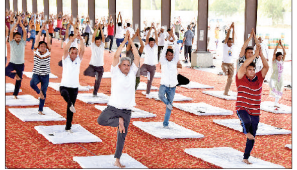
कैथल। अंतरराष्ट्रीय योग दिवस पर योगा करते साधक।