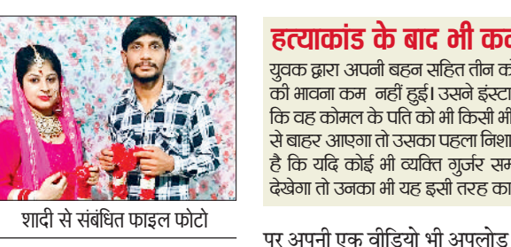
शादी से संबंधित फाइल फोटो

हत्या के बाद ऑटो में सवार होकर खुद थाने पहुंचकर किया संरेड