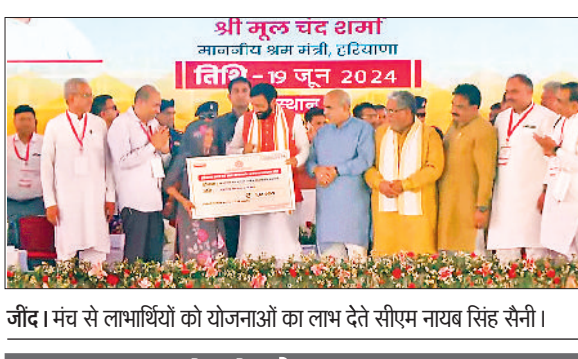
जींद। मंच से लाभार्थियों को योजनाओं का लाभ देते सीएम नायब सिंह सैनी।