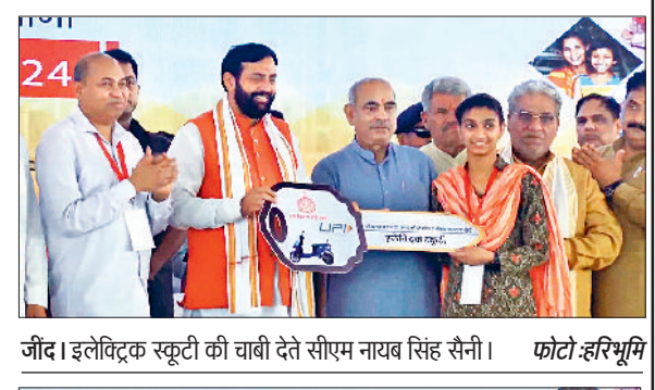
जींद। इलेक्ट्रिक स्कूटी की चाबी देते सीएम नायब सिंह सैनी।

18 योजनाओं के तहत 79.69 करोड़ की लाम राशि जारी श्रमिकों के कल्याणार्थ यथाई जा रही योजनाओं का लाभ देने के लिए सरकार ने जींद में राज्य स्तरीय श्रमिक जागरूकता एवं सम्मान समारोह का आयोजन किया गया था। जिसमें मुख्यमंत्री नायब सिंह सैनी ने 18 योजनाओं के तहत 102629 श्रमिकों को 79.69 करोड़ के लाम की राशि जारी की। बुधवार को जारी किए गए लामों में 42,166 महिलाओं के खातों में सिस्टाई मशीन के लिए 15 करोड़ खात लाख रुपये, साइकिल योजना के तहत 19.925 श्रमिकों को 9.95 करोड़ रुपये, औजार खरीदने के लिए 19.880 श्रमिकों को 15.90 करोड़ रुपये जारी किए गए। वहीं पंजीकृत श्रमिकों के बच्चों की शिक्षा के लिए 3068 बच्चों को 2.96 करोड़ रुपये और इलेक्ट्रिक स्कूटर योजना के तहत ई-स्कूटर की खरीद के लिए 1446 बच्चों को 7.23 करोड़ की राशि सीधे उनके खातों में डाली गई है। इसी प्रकार बेटों की शादी के लिए वित्तीय सहायता और कन्यादान योजना के तहत आज 1206 श्रमिकों के खातों में 12.18 करोड़ रुपये, पंजीकृत श्रमिक के मोबाइल बच्चों के लिए छात्रवृत्ति योजना के तहत 379 बच्चों को 1.25 करोड़ रुपये की राशि सीधे उनके खातों में डाली गई है।