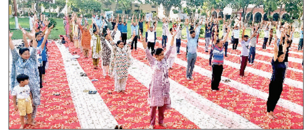
सीवन। पायलट रिहर्सल में योग करते साधक।