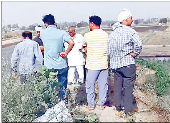
सफीदों। राजबाहे को मिट्टी के कट्टे डालकर पाटते हुए लोग व मौके पर पहुंचे किसान व अधिकारी।