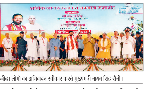
जींद। लोगों का अभिवादन स्वीकार करते मुख्यमंत्री नायब सिंह सैनी।