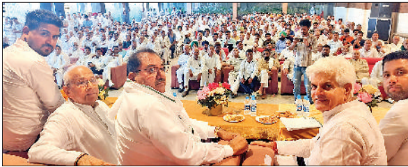
कैथल। विधायक अभय चौटाला कार्यकर्ताओं से बातचीत करते।

इनेलो के वरिष्ठ नेता एवं विधायक अभय चौटाला ने कहा कि इनेलो कार्यकर्ता ने लोकसभा चुनाव में जो काम किया वह काबिले तारीफ है। इसी का परिणाम है कि इनेलो कार्यकर्ताओं ने इंडिया गठबंधन को सही जगह दिखाने का काम किया। लोकसभा चुनाव के बाद आयोजित कार्यकर्ताओं की बैठक में अभय चौटाला ने कहा कि कार्यकर्ताओं ने लोकसभा चुनाव में खूब मेहनत की। इसके लिए सभी कार्यकर्ता बधाई के पात्र हैं। इतनी गर्मी में इस बैठक में पहुंचने कार्यकर्ताओं का हौसला बताता है कि आने वाला